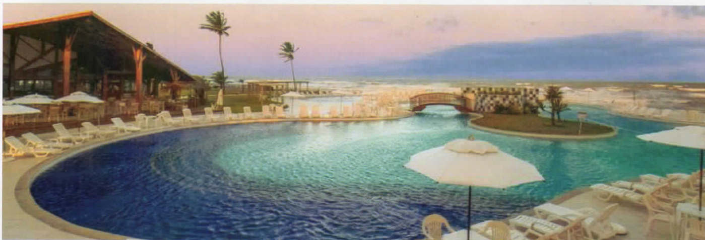
Prodigy Beach Resort & Conventions, local de hospedagem dos afabeguianos.

Com total suporte da Diretoria da Afabeg, 77 pessoas, afabeguianos e acompanhantes, viajaram para Aracaju/SE. O passeio aconteceu no período de 21 a 28 de setembro, com hospedagem no Prodigy Beach Resort & Conventions. A programação incluiu passeio à Foz do Rio São Francisco, no local onde o rio deságua no mar, com parada para almoço no restaurante Marinas Clube; passeio de Catamarã à Crôa do Goré, uma pequena ilha de areia branca, que surge somente na maré baixa, localizada no rio Vaza Barris, e Ilha dos Namorados, uma grande ilha formada entre o rio Vaza Barris e o Oceano Atlântico; city tour nos principais pontos turísticos da cidade, como Mercado Municipal, Passarela do Carangueijo,