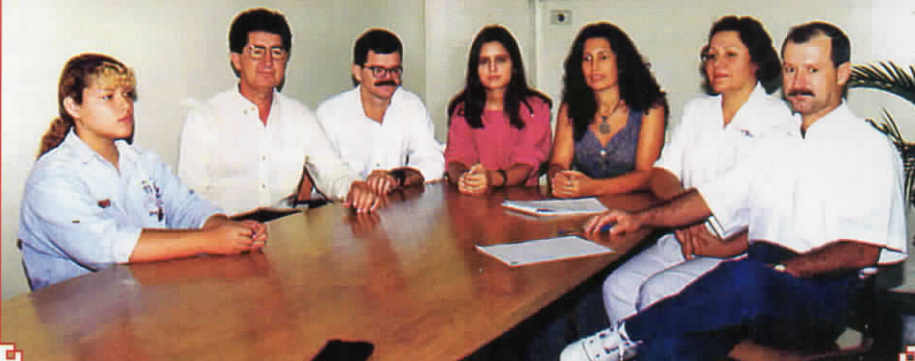
Foto da equipe do Departamento de Crédito Imobiliário do BEG, de fevereiro de 1994.